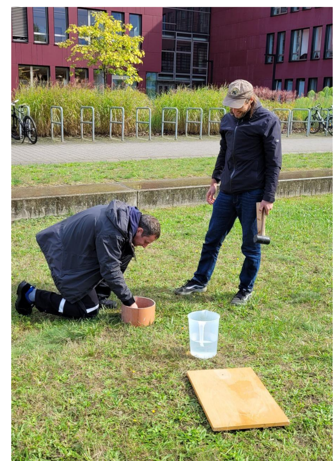
Infiltrationsmessung auf einer Versickerungsanlage