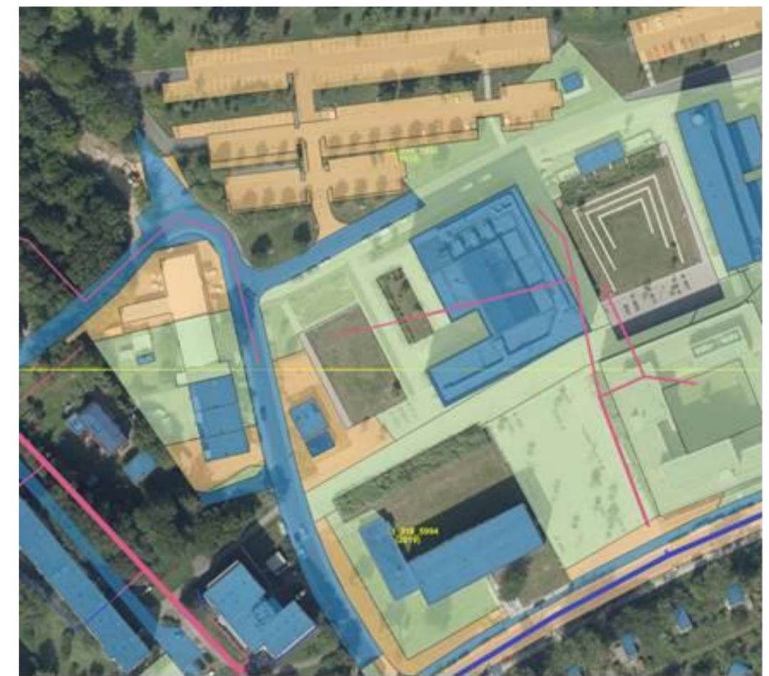
Orthophoto des Südstadt-Campus mit Flächenkategorien der stofflichen Belastung