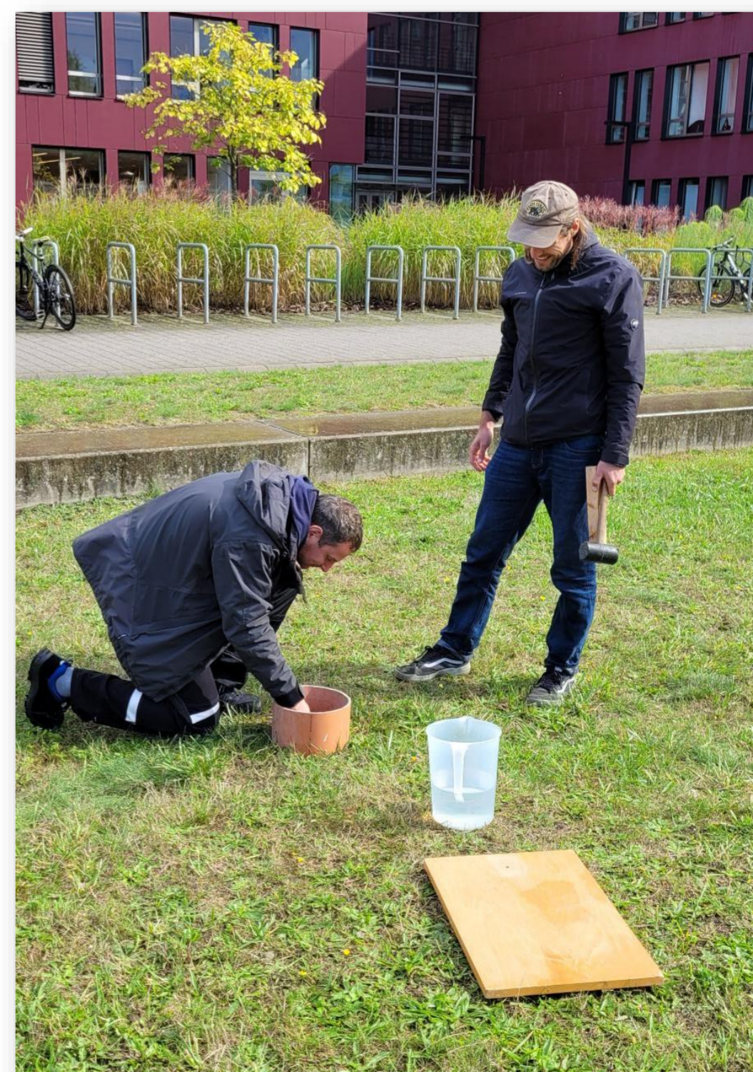
Infiltrationsmessung auf einer Versickerungsanlage