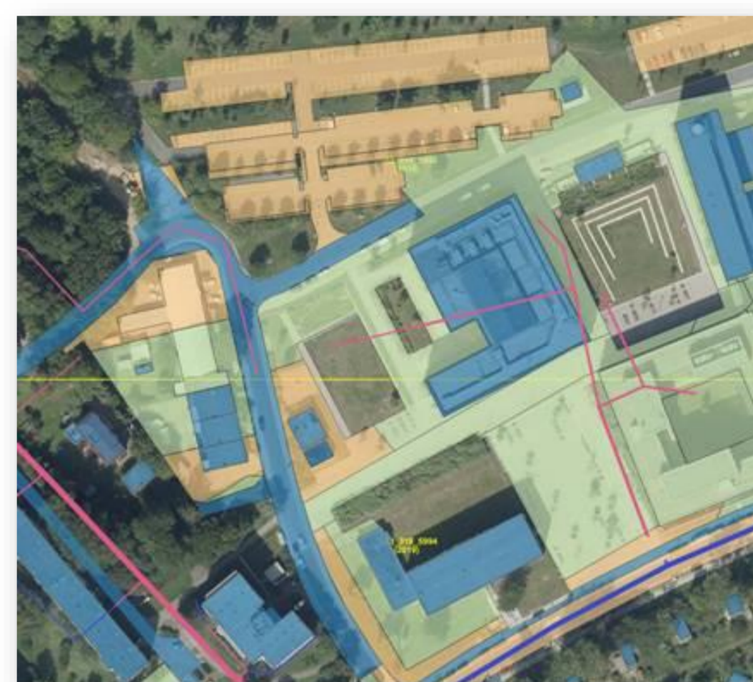
Orthophoto des Südstadt-Campus mit Flächenkategorien der stofflichen Belastung