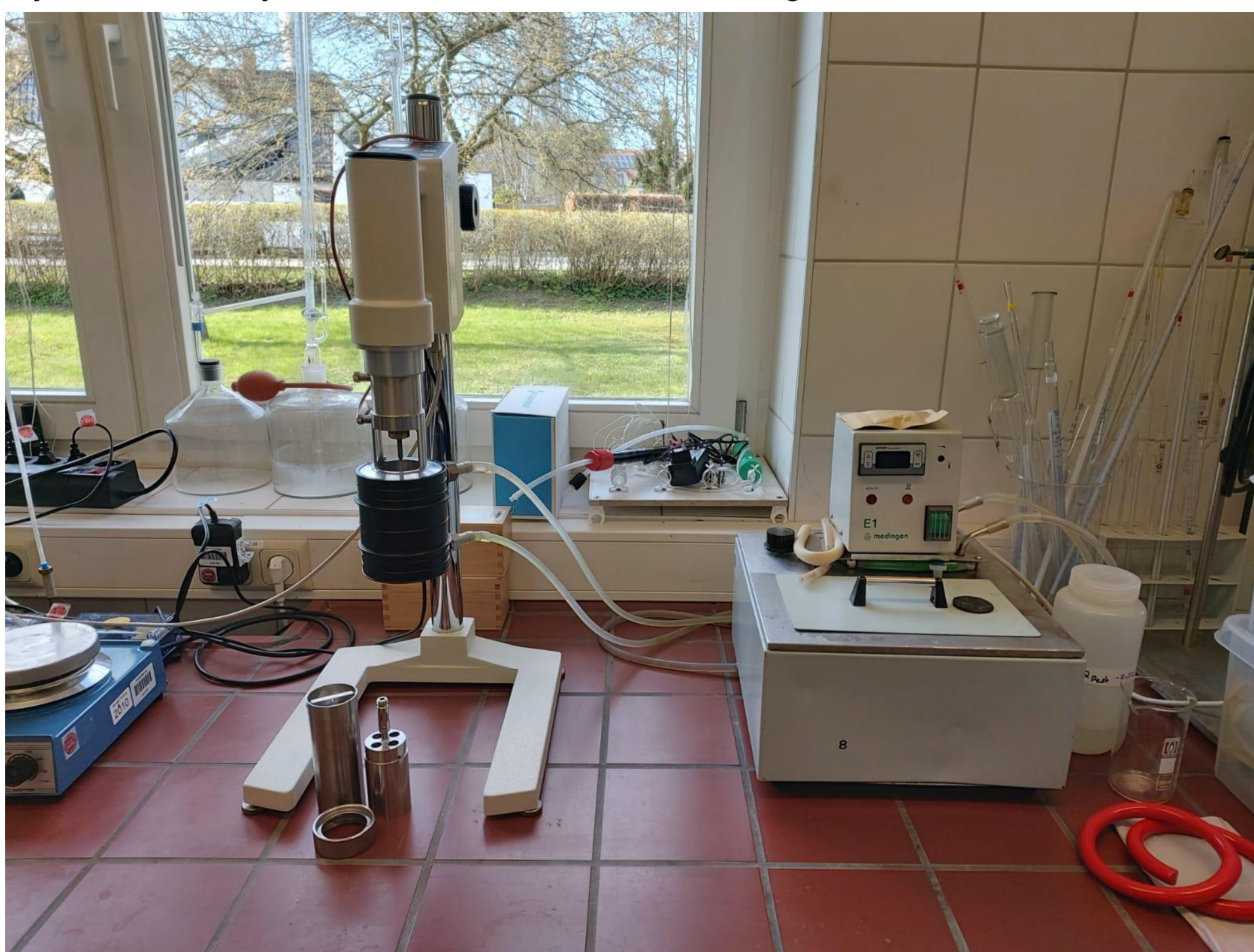
Abbildung 1: Viscotester 550 mit koaxialem Zylindermesssystem

Zur Charakterisierung der Belebtschlammproben der zentralen Kläranlage Rostock wurde der TS-Gehalt bestimmt und eine Absetzkurve aufgezeichnet. Für die Viskositätsmessungen wurde das Viskosimeter Viscotester 550 der Firma Haake verwendet. Hierbei wurde ein koaxiales Zylindermesssystem für niederviskose Flüssigkeiten verwendet.