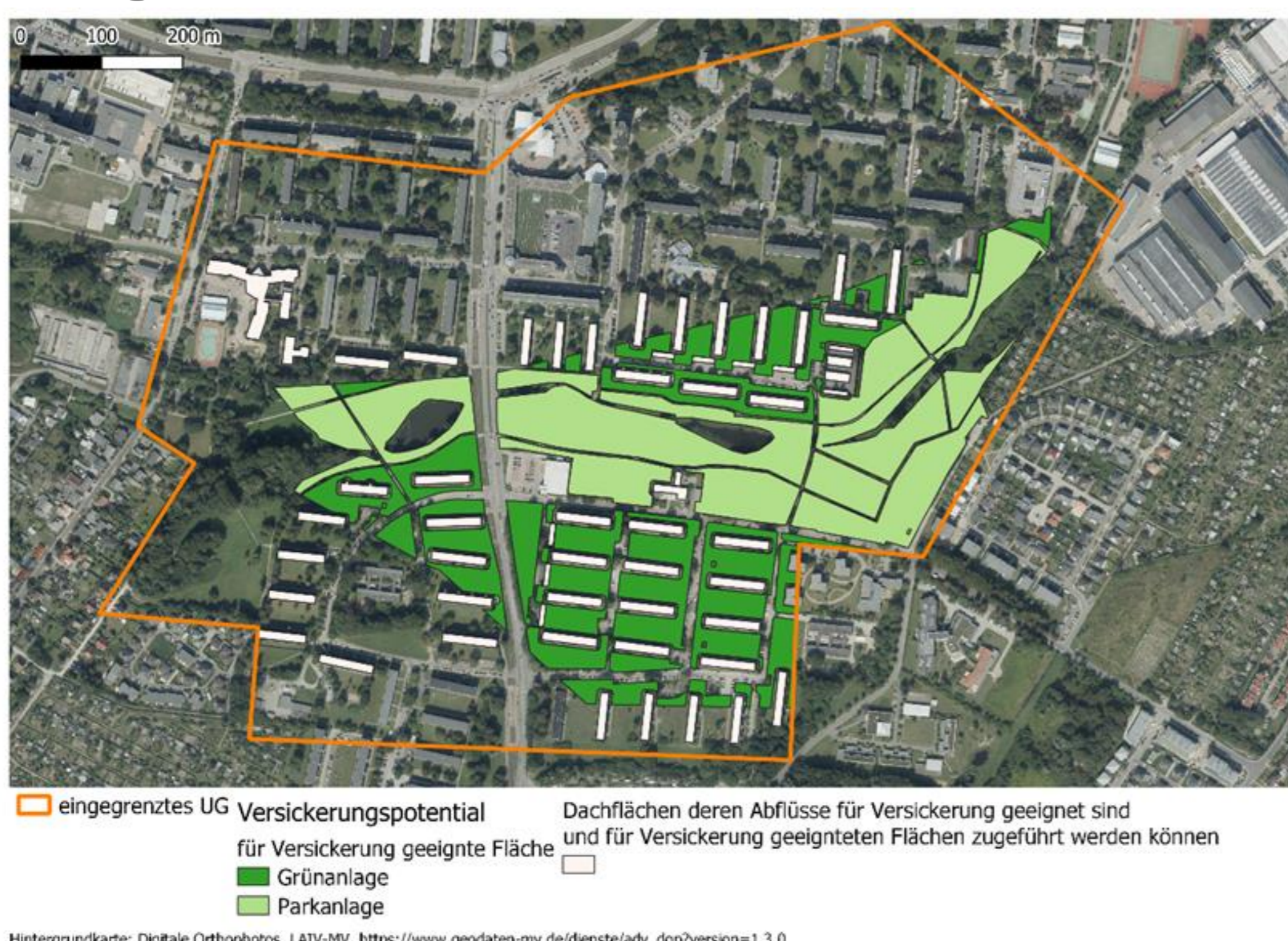
Abbildung 1: Darstellung der abgeschätzten Flächen die Mittels Versickerung entwässert werden können (eigene Darstellung)